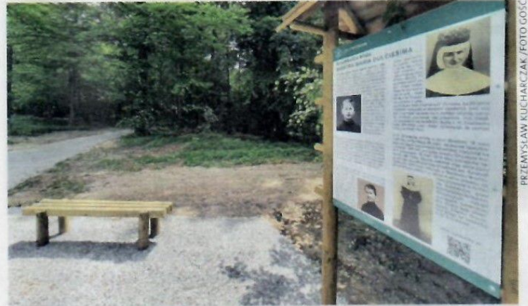
▲ To miejsce przypomina o dziewczynie ze Zgody (dziś dzielnica Świętochłowic), której proces beatyfikacyjny jest w toku.

Kilkadziesiąt lat temu ten teren był znany ze wspaniałych, widoków – stąd nazwa las Widok. Dziś krajobrazy są zasłonięte przez korony drzew. Jeśli jednak dysponujemy samochodem, w ciągu 4 minut możemy dojechać do wieży widokowej przy ulicy Lubomskiej w Pogrzebieniu. Wstęp na nią jest