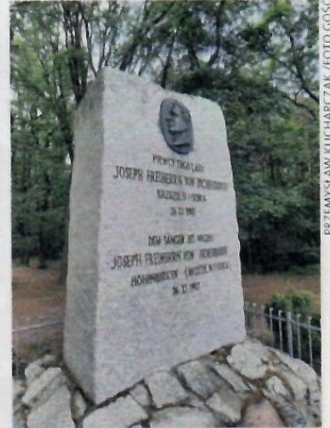
▲ Głaz ku pamięci Josepha Eichendorffa, który rozstawił to miejsce.

bezpłatny. Roztacza się z niej widok na dolinę Odry, Sudety i Beskidy.